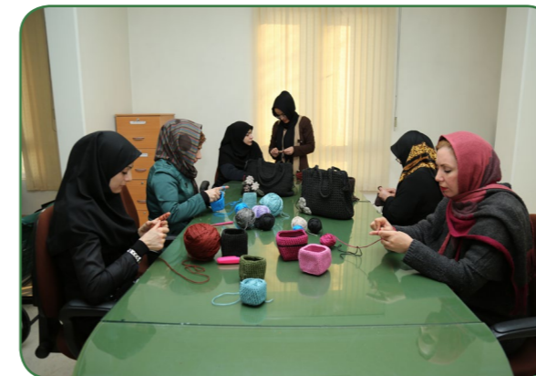
مصاحبه با یکی از مادرانی که در کلاسهای آموزشی ویژه والدین شرکت داشته است: