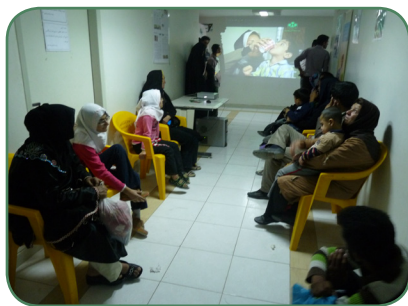
در پی استقبال خانواده ها از خدمات آموزشی طرح: