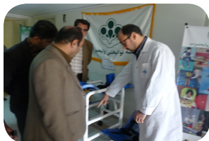
مدیرکل بهزیستی استان فارس در بازدید از محل اجرای طرح:

مددجویان از شهرها و روستاهای مختلف استان فارس جهت دریافت وسایل کمک توانبخشی مراجعه می کردند که اسامی این شهرها به خوبی گسترده ای اجرای طرح در سطح استان را نشان می دهد: ارسنجان آباده استهبان اقلید بوانات پاسارگاد جهرم خرامه خرم بید خنج داراب رستم زرین دشت سپیدان سروستان شیراز فراشیند فسا فیروزآباد قیروکارزین کازرون کوار