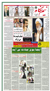
روایت روزنامه نیم نگاه شیراز از طرح: