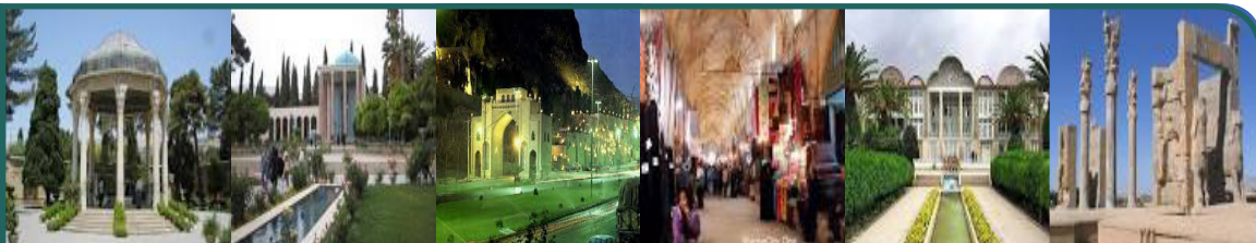
عیدی مؤسسه توانبخشی ولیعصر (عج) به کودکان فلج مغزی استان فارس